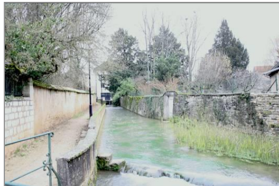
Passage de la Lauve à l'intérieur du bourg