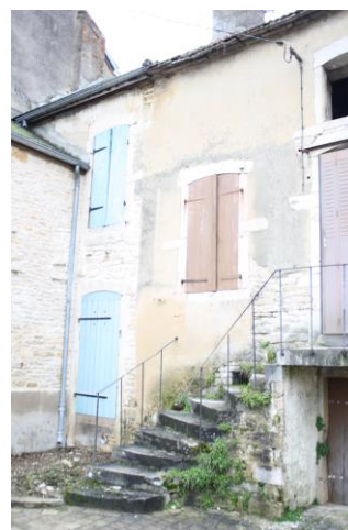
Rue du Bief