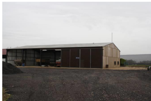
Bâtiment agricole au hameau de Neuville