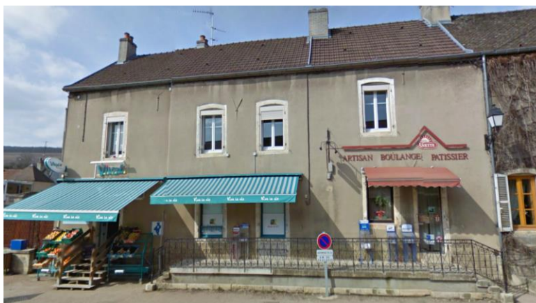
Commerces de proximité, RD 974