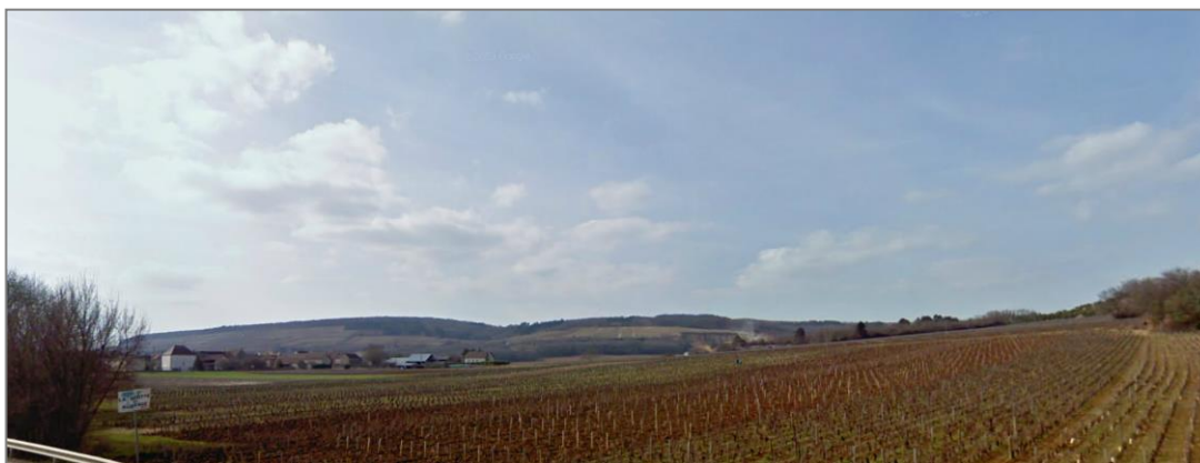
Vue sur la Côte de Beaune, RD 974