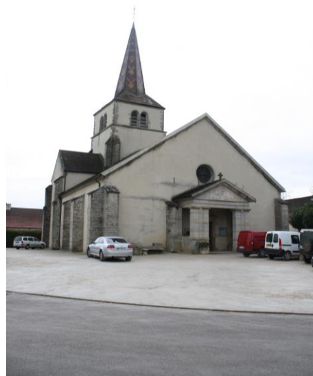
Place de l'Eglise