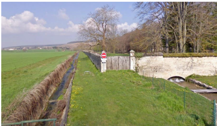
Chemin du Parc